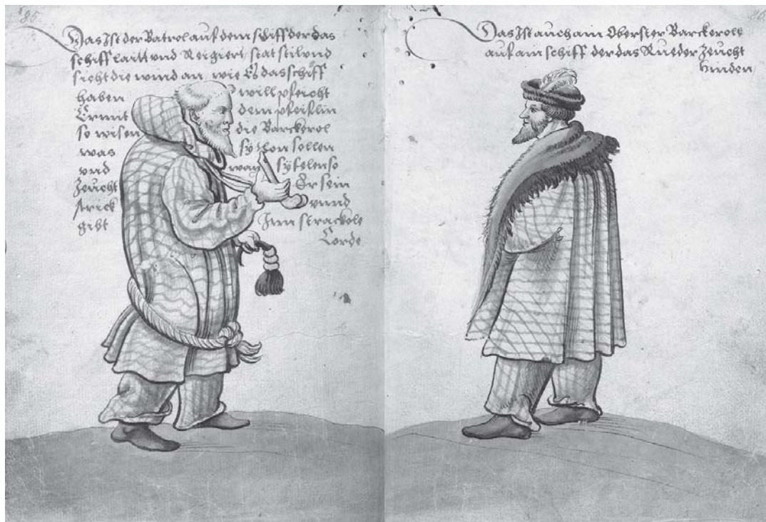
Links der Bootsmann eines spanischen Schiffes mit Strick und Pfeife, rechts ein Steuermann. Aus dem «Trachtenbuch» des Christoph Weiditz, um 1530

sollte die Besatzung des Beibootes ans Ufer gehen und auf einen Berg steigen, um zu schauen, ob sie von dort oben die Ausfahrt sähen. Für den Fall, dass sie Erfolg hätten, versprach er den Kundschaftern eine Belohnung.